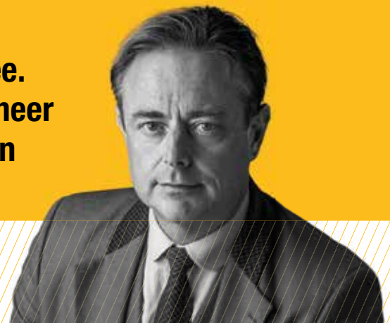
Bart De Wever Voorzitter

“ Bij de N-VA telt uw stem wél mee. De N-VA zal de komende jaren meer dan ooit waken over de belangen van álle Vlamingen.