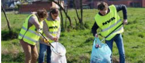
N-VA strijdt tegen zwerfvuil p. 2