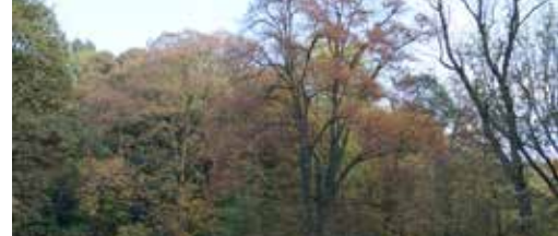
Toerisme verder uitbouwen p. 3